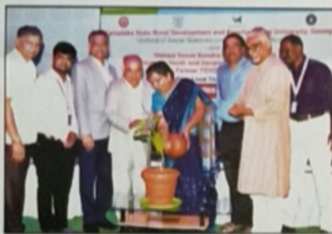
"Two Days State Level Thematic Workshop on "Water, Sanitation and Hygiene : Approaches and Methods" 5-6 th October 2018