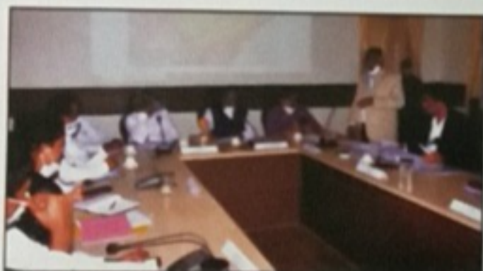
A review meeting under the Chairmanship of the Hon'ble RDPR Minister Shri K. S. Eshwarappa