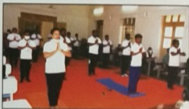
Yogakshema - 21 days Yoga Workshop to boost immunity

At present, the University is housed in the historic Raitha Bhavan Building, Gadag and has a regional office at Bengaluru. The new campus is being developed in the picturesque landscape of about 353 acres of land at the outskirts of Gadag. With fundamental infrastructure a replica of Gandhi Ashram in Sabarmati, Gujarat is also built in the campus in order to propagate Gandhian ideals among the students. 10,000 varieties of trees are planted in the campus which enhances Biodiversity on campus. Water conservation initiatives are the need of the hour, due importance is being given to this aspect in the entire new campus.