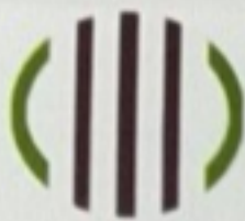
Centre for Educational & Social Studies (CESS), Bengaluru