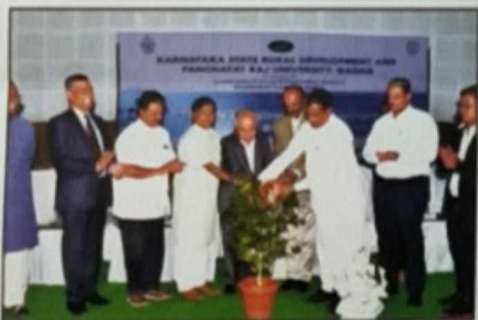
Three day Seminar on "The UN Sustainable Development Goals, Ba-Bapu & Civil Society" 30 th , 31 st May & 1 st June 2019